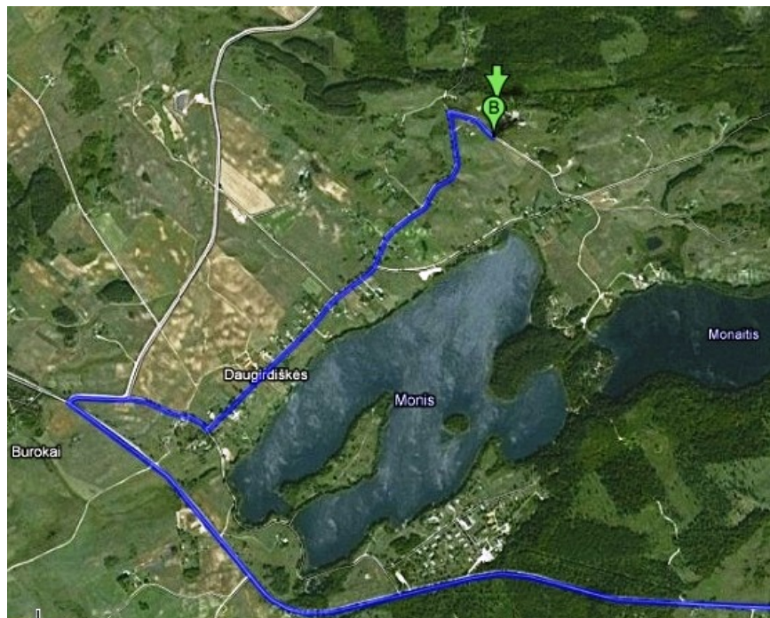
Žemėlapis nuo Daugirdiškių km. iki Mokymo centro „Daugirdiškės“

Aukštadvaryje reikia sukti į Technikumo gatvę, nuo kurios prasideda kelias nr. 221 link Semeliškių ir Vievio. Šiuo keliu važiuoti 13,2 km. iki Semeliškių. Semeliškėse pasukti į dešinę, Trakų gatve pavažiavus 110 m. sukite kairėn ir važiuokite toliau Strėvos gatve 400 m. ir privažiavę pagrindinę gatvę, sukite į dešinę ir važiuokite tiesiai per Semeliškių miestelį, už miestelio pavažiokite dar 4 km. keliu nr. 4709. Tada pamatysite nuorodą į kairę Vievis 16 . Pasukę, laikykitės dešinės ir 650 metrų važiuokite tiesiai Daugirdiškių link. Asfaltuotum keliui pasisukus į kairę, jūs irgi pasisukite ir važiuokite dar 1,9 km. (asfaltas pasibaigs ir tęsis žvyrkelis). Nuvažiavus 1,9 km. ir dar nepasiekus miško T formos sankryžoje ant tvoros rasite rodyklę į mokymų centrą. Pasukite dešinėn į siaurą keliuką ir pavažiokite juo 200 metrų į kalnelį, tada pamatysite berželių alėją kairėjo keliuko pusėje ir dar vieną rodyklę, ten pasukite ir Jūs jau atvykote į mokymų centrą „Daugirdiškės“. Koordinatės navigacijai: 54.659154, 24.763867. Kelionės trukmė – maždaug 30 minučių nuo Aukštadvario, atstumas - 23 kilometrai.